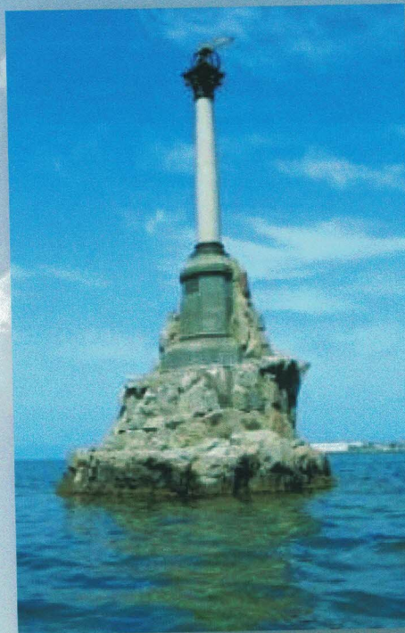
Памятник затопленным кораблям – символ города