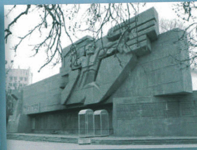
Мемориал героев обороны Севастополя 1941 - 1942 гг.

К концу весны 1942 года немцы стянули к Севастополю 200 000 солдат, 600 самолетов, 450 танков и 2 000 орудий и минометов. Им удалось блокировать город с воздуха и увеличить свою активность на море. Несмотря на это, защитники Севастополя нанесли серьезный урон силам немецко-фашистских войск и нарушили их планы на южном крыле фронта.