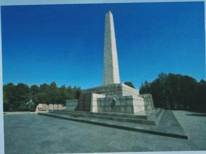
Обелиск Славы на Сапун-горе