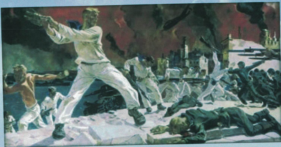
Александр Дейнека «Оборона Севастополя»