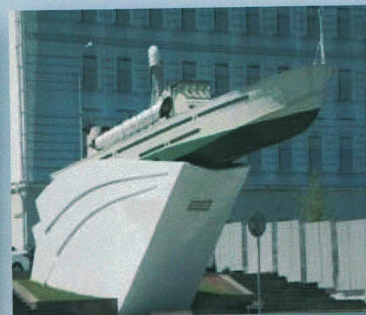
Памятник героическим морякам- черноморцам