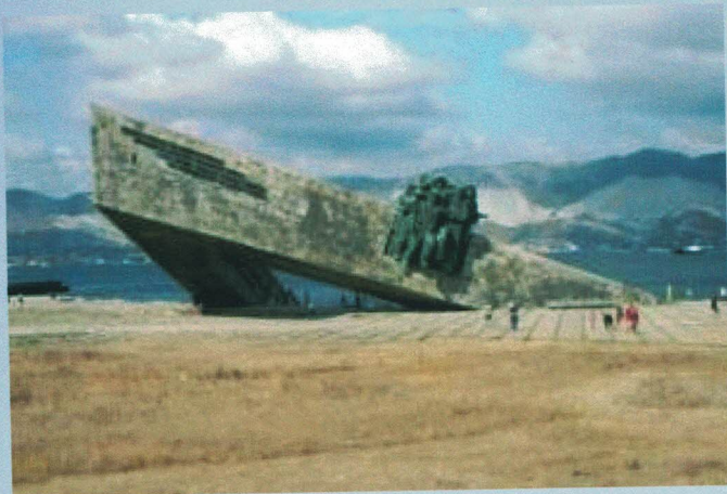
Город-герой Новороссийск. Мемориал «Малая земля»

Особо отличились в борьбе за Новороссийск корабли Черноморского флота. Так, в начале сентября 1942 года эскадронный миноносец «Сообразительный» и лидер «Харьков» нанесли мощные артиллерийские удары по скоплениям немецких войск на подступах к городу. Несмотря на героические усилия защитников Новороссийска, силы были неравными, и 7 сентября 1942 года врагу удалось войти в город и захватить в нем несколько административных объектов. Но уже через четыре дня гитлеровцы были остановлены в юго-восточной части города и перешли к оборонительной позиции.