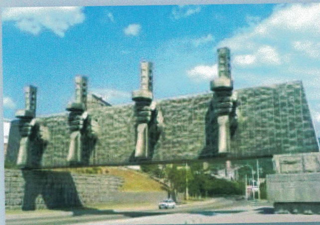
Мемориальный комплекс «Рубеж обороны»