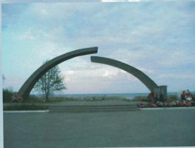
Мемориал на берегу Ладожского озера – «Разорванное кольцо»