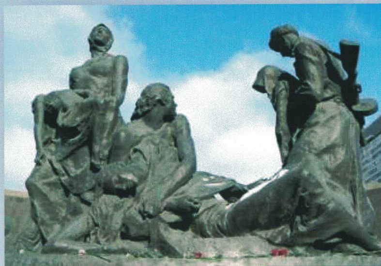
Скульптурная композиция «Блокада»

Примечательными фактами в истории военной летописи города на Неве стали следующие цифры: более 500 тысяч ленинградцев выходили на работы по строительству оборонительных сооружений; ими были построены 35 км баррикад и противотанковых препятствий, а также более 4 000 дзотов и дотов; оборудовано 22 000 огневых точек. Ценой собственного здоровья и жизнью мужественные ленинградцы дали фронту тысячи полевых и морских орудий, отремонтировали и выпустили с конвейера 2 000 танков, изготовили 10 млн снарядов и мин, 225 000 автоматов и 12 000 миномётов.