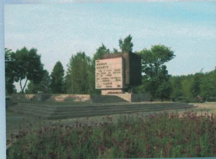
Памятник «Рубежный камень». Мемориал «Невский пятачок»