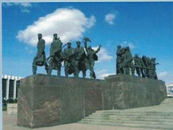
Мемориал героическим защитникам Ленинграда

С этого момента началась печально известная 900-дневная блокада города, продолжавшаяся до января 1944 года. Несмотря на начавшийся ужасный голод и непрерывные атаки врага, в результате которых погибли почти 650 000 жителей Ленинграда, они показали себя настоящими героями, все свои силы направлявшими на борьбу с фашистскими захватчиками.