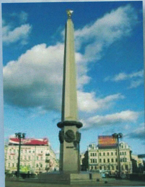
Обелиск «Город - герой»

Первый прорыв блокады Ленинграда произошел 18 января 1943 года усилиями войск Волховского и Ленинградского фронтов, когда между линией фронта и Ладожским озером был образован коридор 8-11 км шириной. А через год Ленинград был полностью освобожден. 22 декабря 1942 года Указом Президиума ВС СССР была учреждена медаль «За оборону Ленинграда», которой удостоились около 1,5 млн защитников города. Впервые городом-героем Ленинград был назван в приказе Сталина от 1 мая 1945 г. В 1965 году это звание ему было присвоено официально.