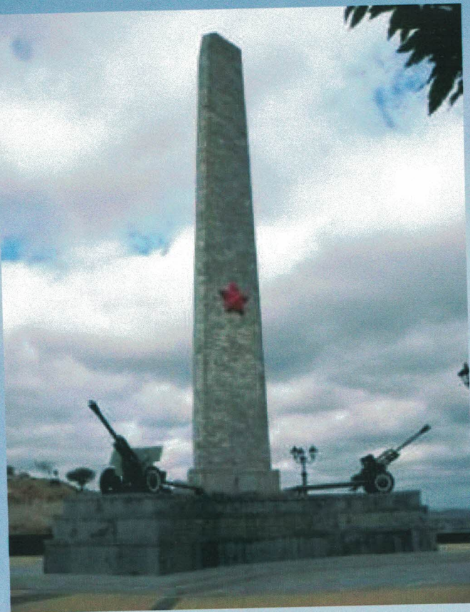
Обелиск Славы на горе Митридат

Керчь была одним из первых городов, попавших под удар немецко-фашистских войск в начале войны. За все время через нее четырежды проходила линия фронта, город был дважды оккупирован немецко-фашистскими войсками, в результате чего было убито 15 тысяч мирных жителей, а более 14 тысяч человек угнано в Германию на принудительные работы. 30 декабря в ходе Керченско-Феодосийской десантной операции город освободили войска 51-й армии.