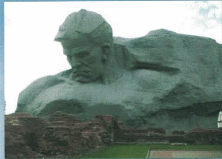
Крепость-герой Брест. Монумент «Мужество»

Согласно положению от 8 мая 1965 года, городу-герою вручается орден Ленина и медаль «Золотая Звезда», которые разрешено было размещать на флаге и гербе города. Также в этих городах устанавливался памятный обелиск с текстом наградного Указа и изображением Золотой звезды.