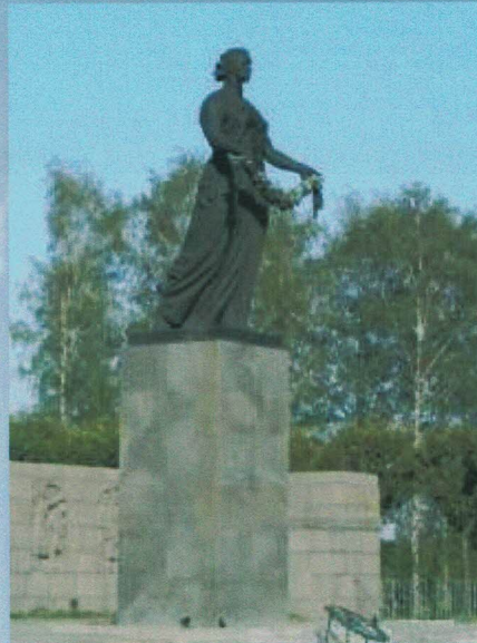
Город-герой Волгоград. «Мамаев курган»